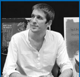
Guitare & Violoncelle